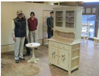
キャビネット（食器棚）製作