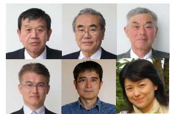
現役で活躍する大工・庭師の講師陣

職藝学院では、実際に社会で活躍されている方々を講師に招き、実践的授業を行っています。実習では、「大工」、「庭師」の名人（マイスター）から手仕事の技を学びます。