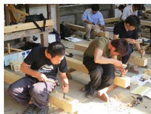
木組み基本工作実習

授業時間(科目授業)は、文部科学省基準(年 800 時間)の 1.5 倍です。[本科]2 年間で 2,400 時間、[研究科]1 年間では 1,280 時間で、実習中心のカリキュラムとしています。