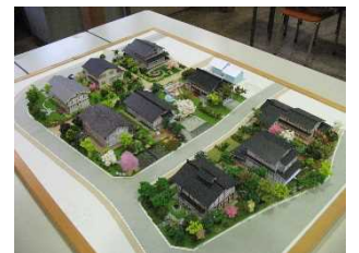
庭づくりと建築づくりを学ぶ演習授業「合科ワークショップ」（集落づくり計画）