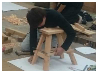
建築大工技能士実技実習