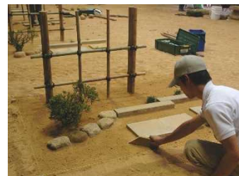
造園技能士実技実習