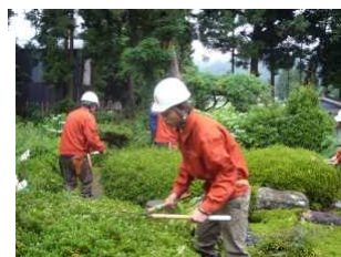
黒部市指定名勝「松桜閣」庭園せん定実習（富山県黒部市）

現場で実際に作る建築物や庭を“実物教材”として、一般から受け入れています。これまで、木造建築の新築・再生・解体、日本庭園やガーデンづくり、文化財（社寺等）の保存修復などに取り組んでいます。