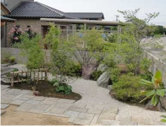
K邸作庭（富山県射水市）：大きな庭石と樹木の再活用