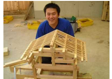
入学生のほとんどが未経験者です。スタッフが実習等のサポートをします。

経験はなくても全く問題はありません。授業は基礎的な内容からスタートし、段階を経ながら建築や環境の専門的内容へと進みます。大工道具や庭師道具を使って学ぶ“実習”を中心に、スタッフが随時サポートいたします。