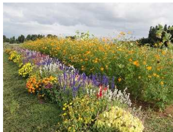
市民農園花壇（富山市）：有機無農薬で管理するガーデン