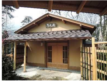
茶室「本丸亭」新築（富山市）：伝統的木組み構法による木造建築