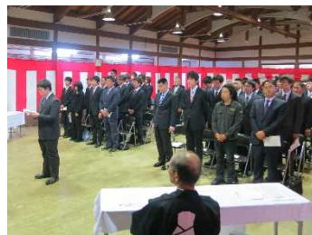
職藝学院入学式。全国各地から入学しています。

高校卒業が入学条件です。高校新卒はもちろん、大学卒、社会経験者も多く入学しています。また、入学生は北海道から沖縄までの日本全国に及び、全体の約50%が富山県外の出身者です。