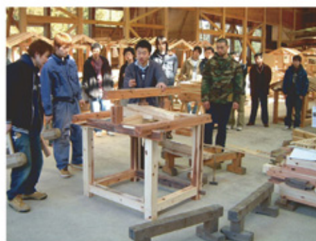
〈建築大工コース 卒業製作〉

また専門学科で木造建築を中心に、材料・構法や関連法規を知り、設計と仕様積算及び建築施工・規矩術などを学びます。