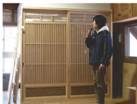
〈建具大工コース 卒業製作〉

さらに実際の各種建具の製作と現場での建てこみ作業にも携わり実践的な技術を磨きます。