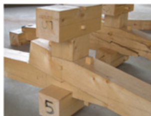
〈基礎実習での仕口・継手製作〉