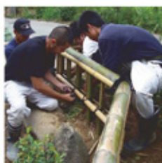
〈造園師コース 竹垣実習〉