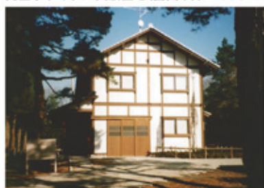
完全リサイクル実験住宅(富山市)／1998・2001

建築2期生新築(家具・建具共) 建築4期生解体・再建築 LCCO削減のための木造実験住宅