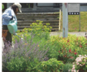
〈園藝師コース 花壇実習〉