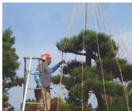
〈造園師コース 雪吊り実習〉

造園師の職業には造園工事業、園藝師には園芸・ガーデニング業などがあります。また当学院で学んだ技能と知識を生かし、ガーデンデザイナーやエクステリアデザイナー及びランドスケープアーキテクト、さらには樹木医などの道へ進むこともできます。