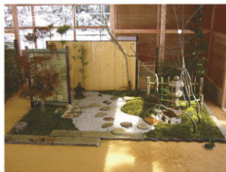
〈造園師コース 卒業製作〉

剪定・石組みなどの庭師の基礎技能を学んだ上で、花卉(かき)園芸植物を中心とした栽培・管理や植栽デザインと花の庭づくりを学びます。 さらに“実物実習教材”の草花をあしらった住宅庭園作庭や再生・修復、花壇の施工にも携わり実践的な技術を磨きます。