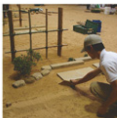
〈造園及び室内園芸装飾技能士実技実習〉