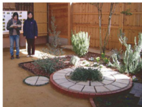
〈園藝師コース 進級製作〉