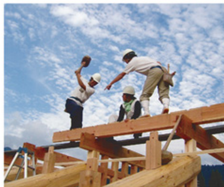
〈建築大工コース 建方実習〉

建築大工の職業には宮大工を含む大工工事業、木造建築工事業など、家具大工には木製家具製造業、家具修理業など、建具大工には建具製造業や木製建具工事業などがあります。また当学院で学ぶ技能と知識を生かし、木造建築や家具・建具の設計デザインの道へ進むこともできます。