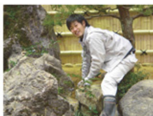
〈造園師コース 石組実習〉