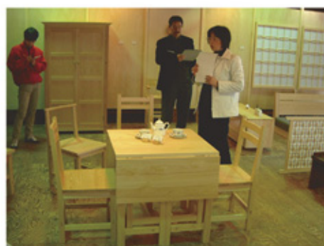
〈家具大工コース 卒業製作〉

さらに、テーブル・椅子や食器棚など実際の実用的家具づくりにより実践的な技術を磨きます。