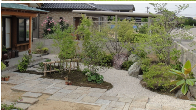
K邸 庭園 新設造園(富山県射水市)