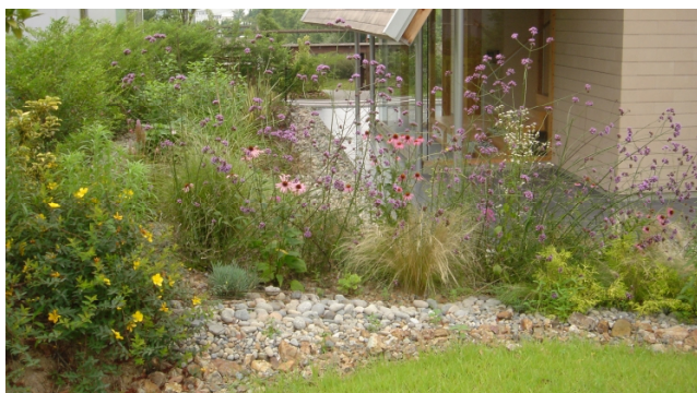
ワボットハウス ガーデン 新設ガーデニング(岐阜県各務ヶ原市)