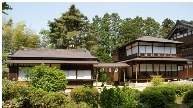
「松桜閣（北陸の銀閣）・庭園」 木造2階建 文化財修復・庭園再生(富山県黒部市)