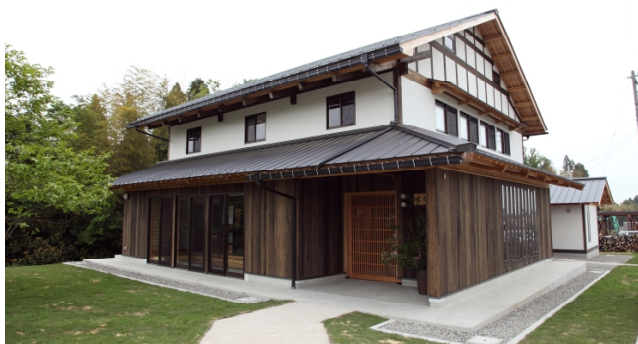
開ヶ丘キャンパス「交流館（玄德館）」 木造2階建 古民家再生(富山県富山市)